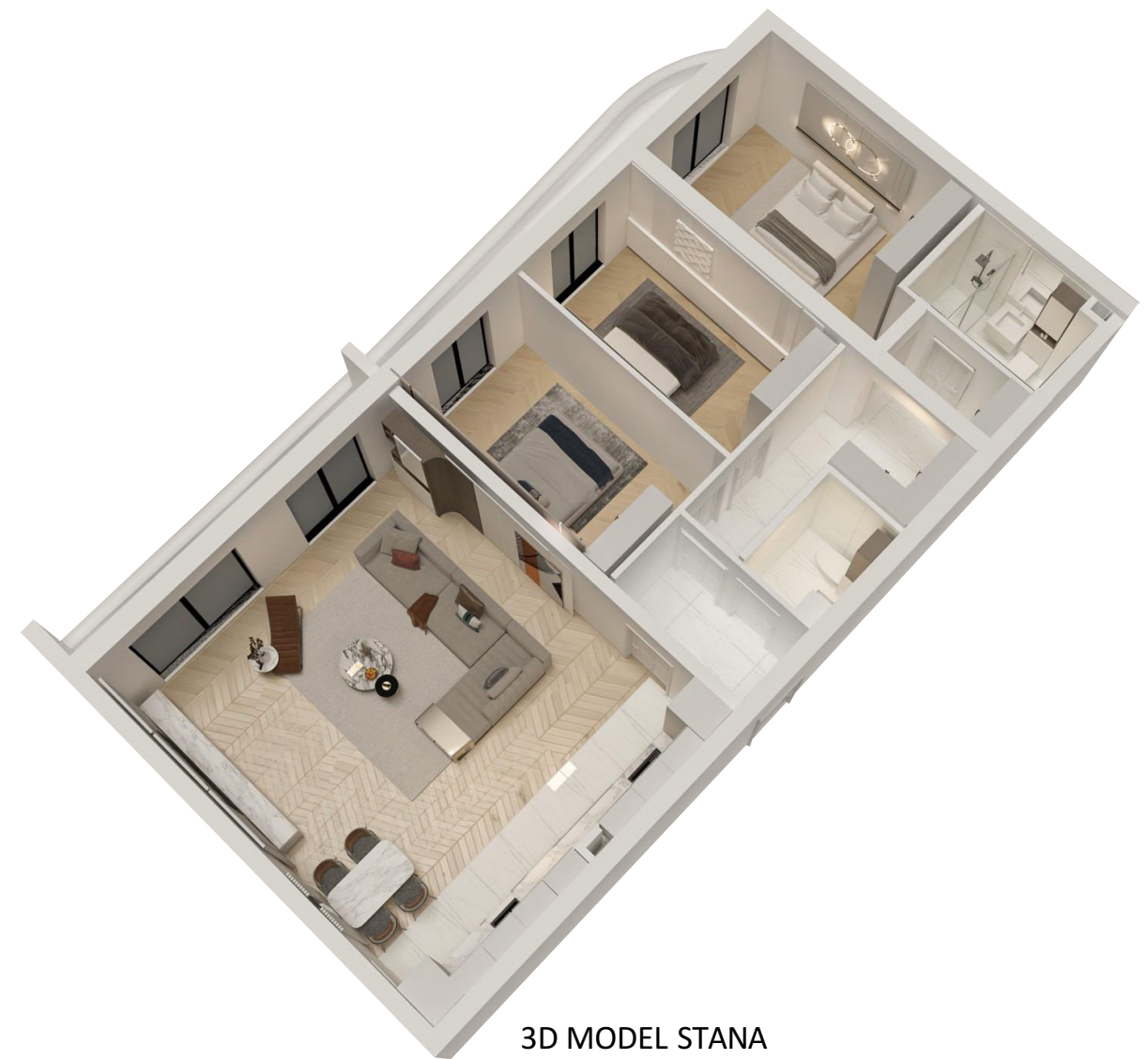
3D MODEL STANA